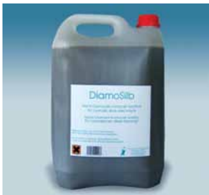
Рис.1. Добавка DiamoSilb

Ряд лабораторных исследований доказал также возможность введения гальванических добавок в состав других материалов, в том числе содержащих золото,