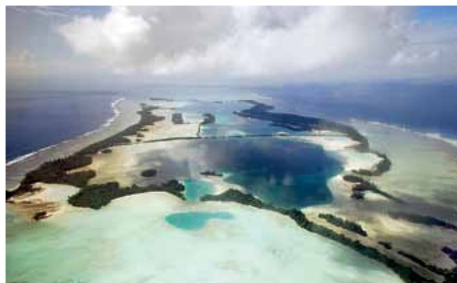
Рис.3. Коралловый атолл

Следующее интересное изобретение океана – образование коралловых атоллов (рис.3). Кораллы – это продукты жизнедеятельности живых существ – полипов, имеющих кишку-мешочек и щупальца, расположенные в твердом