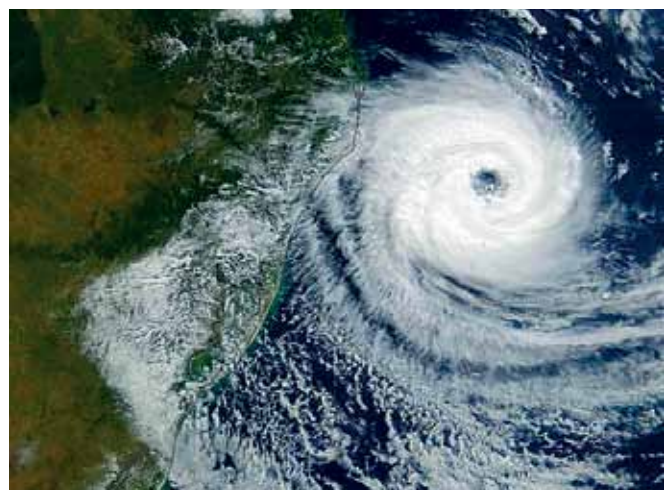
Рис.4. Формирование циклона

Часто острова образуются при извержении подводных вулканов, например, о. Пасхи. Соловецкие острова стали подниматься из моря после того, как скальные участки суши были разрушены и вдавлены ледником. Внутри земной коры образовалось излишнее давление, выдавливающее их наружу. В любом случае появление островов способствовало развитию человеческой цивилизации. Тот же о. Пасхи показал