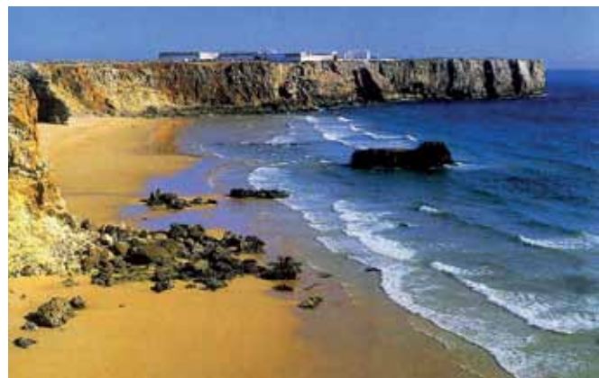
Рис.1. Формирование океанского берега

Берег часто представляет собой обрывистый склон и линию прибоя в виде пляжа с песком или галькой (рис.1). Морские и океанские волны обладают большой разрушительной силой. При шторме и скорости ветра более 20 м/с давление на береговые скалы обычно составляет 3–10 т/м 2 . На берегах Черного моря оно достигает 3 т/м 2 , а на побережье Южной Америки – до 30 т/м 2 . Разрушительной силе волн способствует механическое воздействие на скалы песка и гравия. Наиболее часто первичный берег образуется в результате подъема или опускания суши, либо изменения уровня Мирового океана и имеет некий угол по отношению к горизонту – опускающийся в воду склон. Сначала волны формируют