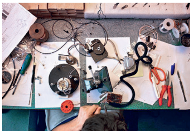
"Рождение" сканирующего зондового микроскопа "ФемтоСкан"

От традиционной 3D-печати фигурок всего один шаг до молекулярного 3D-принтера, который мы создаем на базе сканирующего капиллярного микроскопа [2] в ЦМИТ химического факультета МГУ им. М.В.Ломоносова. В марте нашему ЦМИТ исполняется два года. Важнейшая задача центра – оказание практической помощи студентам и абиту-