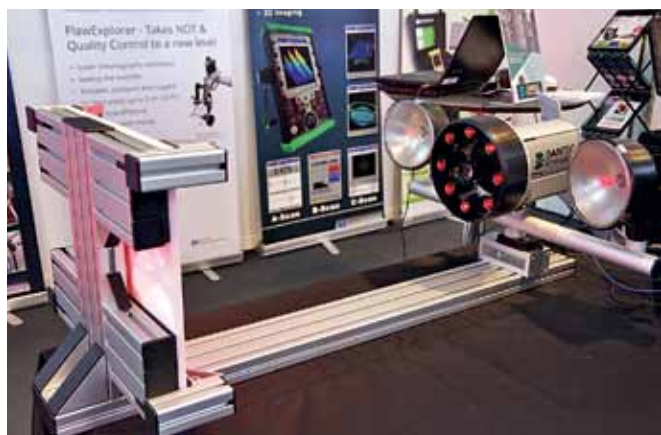
Система лазерной ширографии FlawExplorer FlawExplorer NDT inspection system based on Laser Shearography

отрасли, автомобилестроении, энергетике, судостроении, текстильной промышленности. Деформации и дефекты выявляются в реальном времени с пространственным разрешением до единиц нанометров.